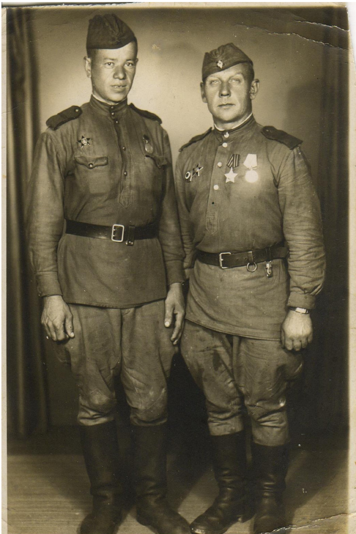
Чехословакия. Саги с сослуживцем. 1942г.